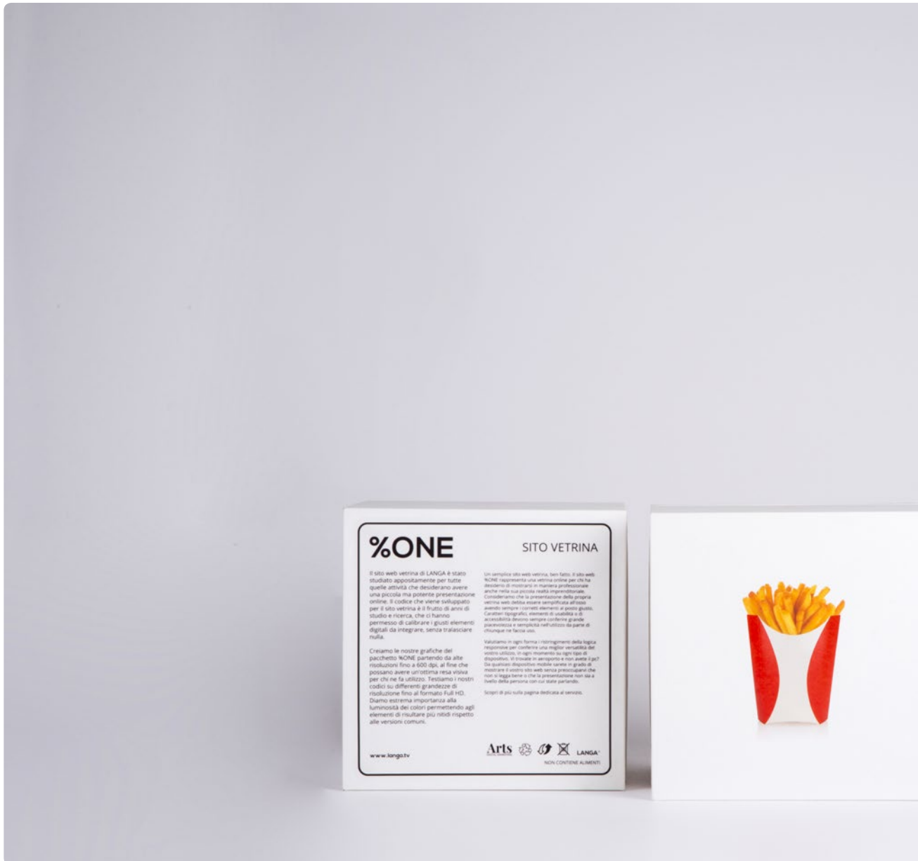
I pacchetti %ONE, disegnati dagli Studi LANGA.