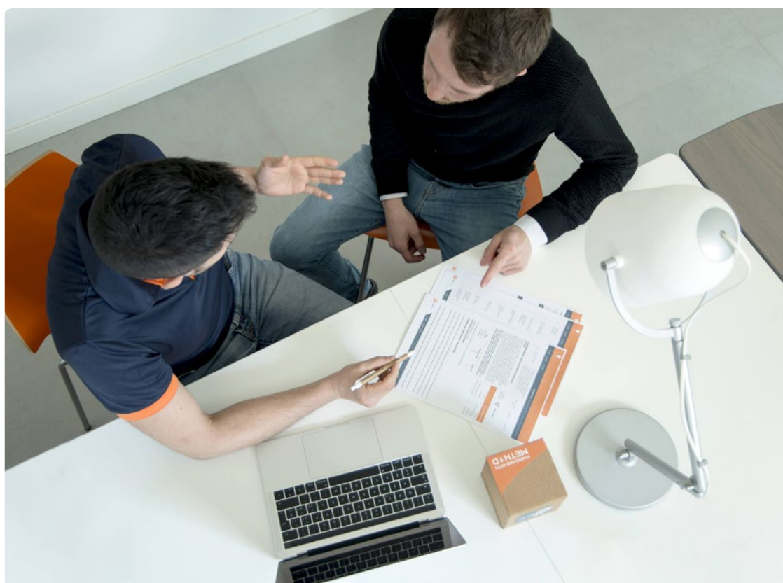
Operatore tecnico durante una revisione.