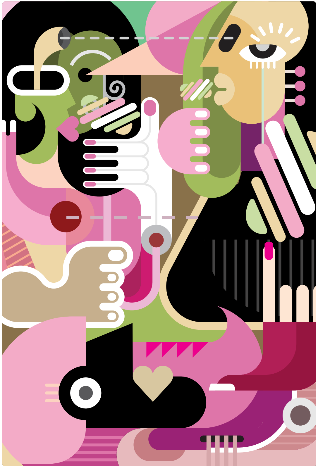
Grafica dedicata all'identità del pacchetto %SHOOTING.